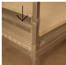
Vaiheet 7 ja 8