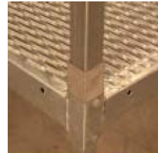
Vaiheet 3 ja 6